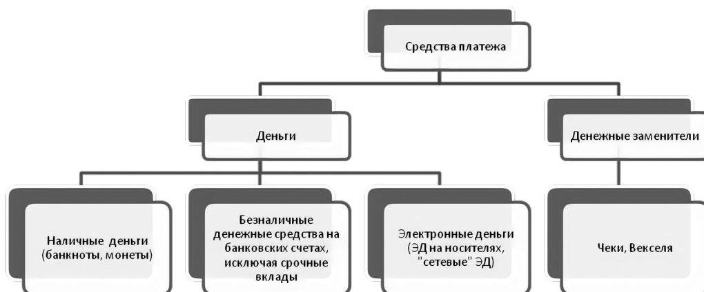
Рисунок 1. Платежные средства

Клиринг – безналичные расчеты между странами, компаниями, предприятиями и банками за поставленные, проданные друг другу товары, ценные бумаги и оказанные услуги, осуществляемые путем взаимного зачета, исходя из условий баланса платежей. Клиринг также используется в банковском деле как «очищение» взаимных обязательств, работая циклически. Для выполнения этих функций банки часто используют клиринговые центры. Таким образом, клиринг выступает формой безналичных двусторонних или многосторонних расчетов в системе